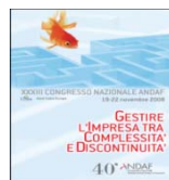
Costa Crociere 2008